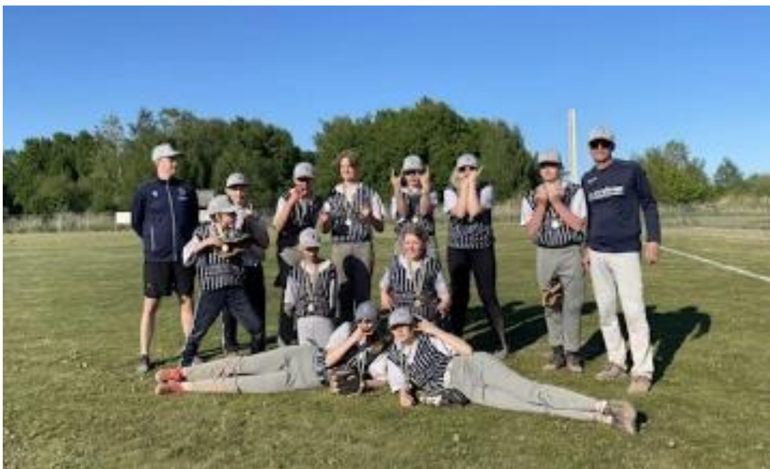
Bild: U15 har spelat Macron Cup på Rosvalla