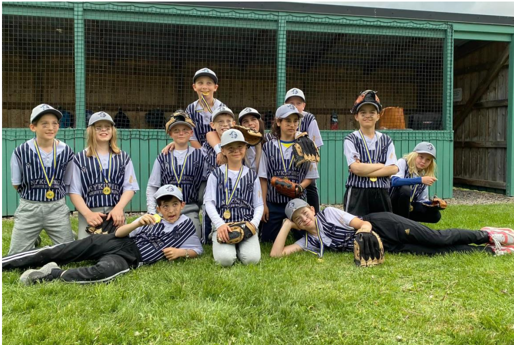
Bild: U12 poserar efter prisutdelning under Macron Cup