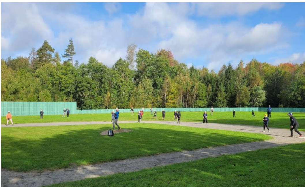
Bild: Ungdomarna vann mot föräldrarna i den traditionsenliga utmanarmatchen

Årets säsong avslutades traditionsenligt med föräldramatch och korvgrillning på Arnöparken, där spelarna även detta år lyckades vinna över föräldrarna vilket bevisar att träning alltid lönar sig.