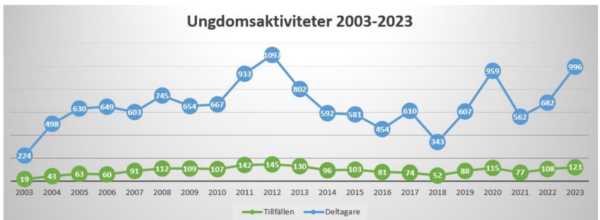
Bild: Statistik över aktivitetstillfällen och deltagare sedan baseboll kom tillbaka till stan

Rekryteringen av spelare till våra lag har fortsatt även under 2023. En av aktiviteterna var prova på baseboll på fritids i samarbete med Herrhagsskolan på Arnö. Tränarna visade även upp baseboll på Stigtomtadagen samt deltog föreningen på sommarens Sportläger på Rosvalla. Då passade många nyfikna ungdomar på att slå och kasta.