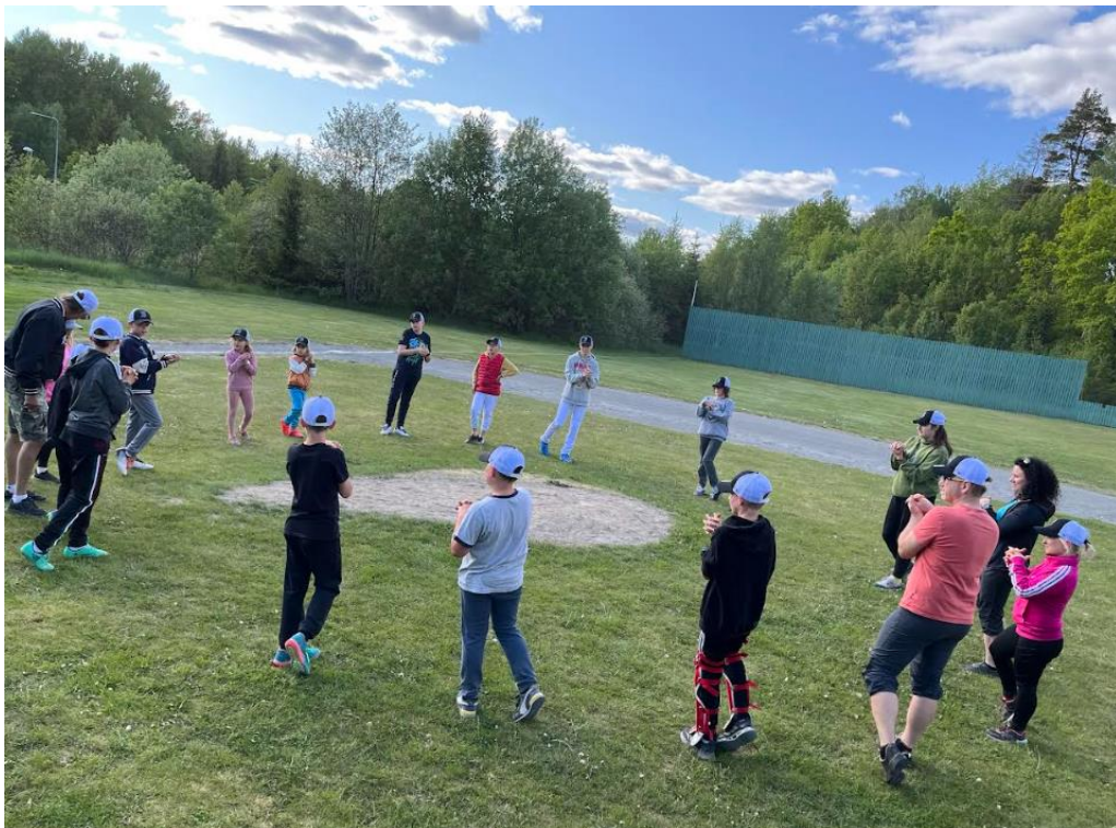
U9 värmer upp på Arnöparken